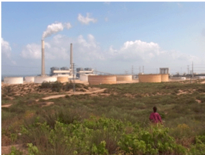
תחנות הכח באשקלון. האם תוקם ארובה שלישית?

שהתנהל אז במליאה נכחו מספר חברי כנסת, שהביעו את דעתם על החוק ועל מצב משק החשמל בישראל, והתרעומת על חברת החשמל ולחציה הייתה גדולה. מדהים איך מאז ועד היום דברים לא השתנו... קבלו את הציטוטים הנבחרים: