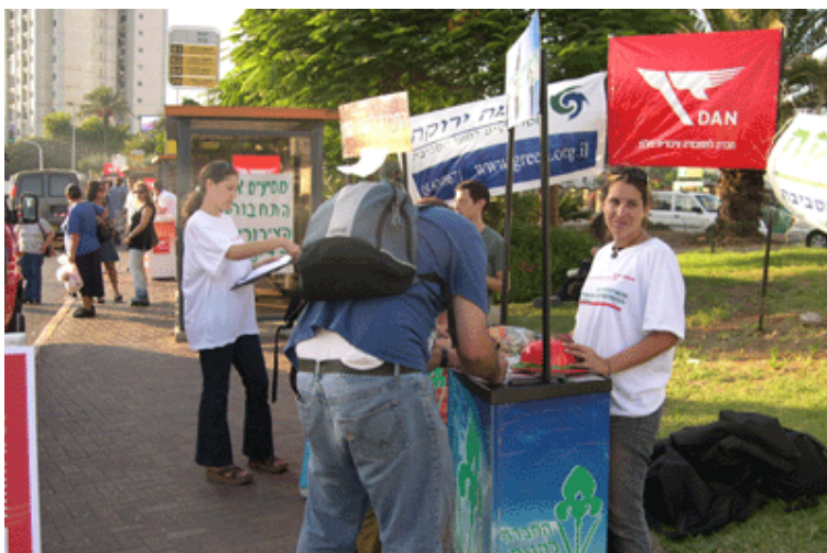
זוכנים מיום תחבורה ראשון - 2004