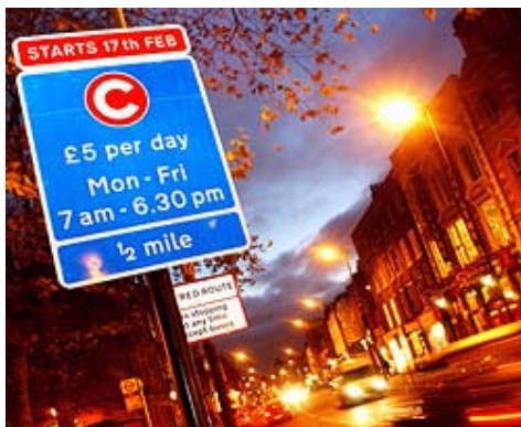
אגרת גודש - לונדון

ברחבי איזור הגבייה מותקנות מצלמות, המתעדות את מספרי הרישוי של כלי-הרכב. מספרי הרישוי המצולמים מוצלבים עם רשימת האגרות, ששולמו באותו יום. אם לא שילם בעל מספר הרישוי באותו יום עבור הכניסה למרכז לונדון, הוא מקבל הודעה על כפל קנס. הקנס ממשיך להכפיל את עצמו עד שבעל כלי-הרכב משלם. כחשובים על זה בליש"ט, המשמעות ברורה - שלם או משכן את הבית.