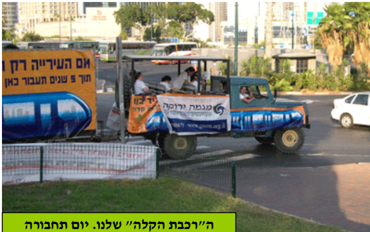
ה"רכבת הקלה" שלנו. יום תחבורה ארצי 2004.