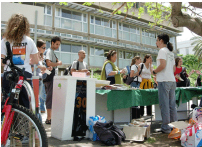
דוכנים ביום ירוק - אוניברסיטת ת"א