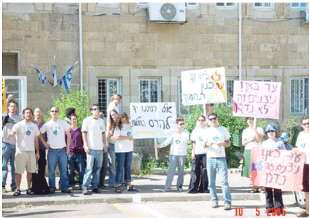
10.5.05 הפגנה מול המועצה הארצית לתכנון ובנייה