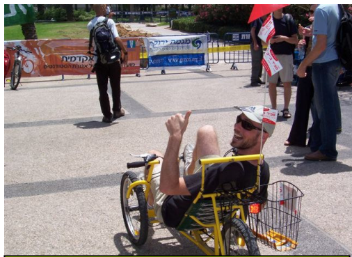
ה"שוס" של האופניים-כולם לקחו סיבוב

המשך היום כלל יריד ארגוני איכות סביבה שהציגו את פעילויותיהם. בין המשתתפים: "ידידי כדור-הארץ המזרח התיכון", "החברה להגנת הטבע סניף ת"א", "אדם טבע ודין", עמותת "ים לכולם", "צלול", ו-תאבי"א ("תל אביב בשביל אופניים"). נציגים של חברת "דן" חילקו מפות קווי אוטובוסים, ונציגים של חנות האופניים "ספיד בייק" הציעו תיקון אופניים לכל דורש.