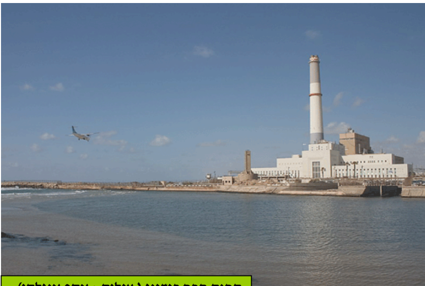
תחנת הכח רידינג

רובנו לא יודעים אבל אם תחזרו 40 שנה אחורה ותפששו בהיסטוריה תגלו שהיא חוזרת ובגדול כמעט מילה במילה. בשנת 1962 הודיעה חברת החשמל, שבדעתה לבנות בצפון תל אביב תחנת כוח חדשה בשם רידינג ד' (התחנה שמוכרת לכולנו...). לאחר 7 שנים מיום ההודעה היא אכן הופעלה לראשונה.