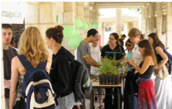
דוכן שתילים – יום ירוק באוניברסיטת ב"ש

אירועי היום הירוק התפרסו על פני שלושה ימים, ועסקו במגוון נושאים, ממקומיים ועד אזוריים וארציים. האירועים נפתחו ביום שני (16.5) כאשר עשרות סטודנטים יצאו רכובים על אופניים מאוניברסיטת בן-גוריון למסע ברחובות העיר, זאת בקריאה לפתח מסלול שבילי אופניים למען תושבי באר