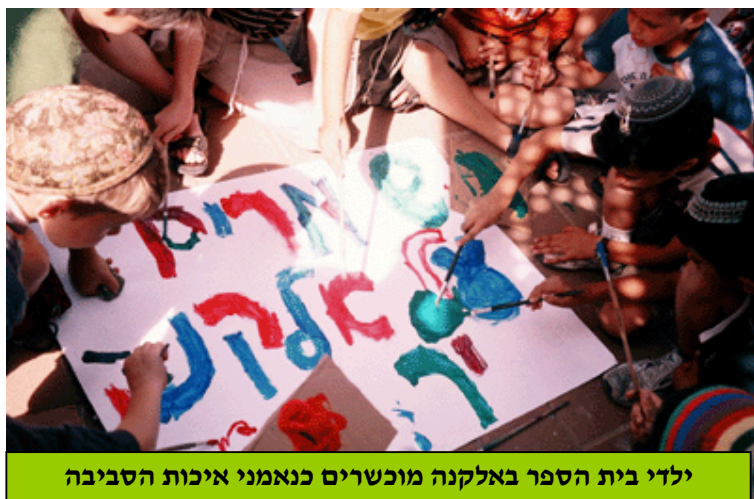
ילדי בית הספר באלקנה מוכשרים כנאמני איכות הסביבה

למכללת אורות היה יום ירוק מיוחד במינו. ניתן לומר כי פעילי המגמה במכללה הטמיעו באופן משמעותי ורציני את חשיבות שילוב הסביבה בחינוך. פעילויות היום הירוק (18.5) של המכללה התרכזו בבית הספר הממלכתי של אלקנה. בבית הספר הוקמו שלוש תחנות ביניהן עברו התלמידים, שוודאי שמחו לא ללמוד. בתחנה הראשונה התקיימה הצגה בנושא מחזור. תחנה שנייה הייתה סדנת יצירה אומנותית באמצעות חומרים ממוחזרים. התחנה השלישית והאחרונה התרכזו בהכנת סלוגנים וסיסמאות של נאמני סביבה. פרט לכיף ולהנאה במשך הפעילות