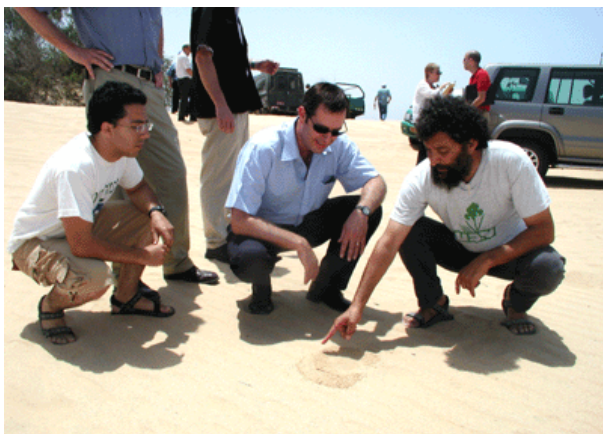
20.5.05 "פינס עמוד על המשמר", נכתב בשלט שקידם את ביקור השר בניצנים (השלט נגנז)

רוב השבוע הכנו את מטלות ההגשה של הסמסטר השני, נוכחנו בהרצאות החשובות ועבדנו. בשאר הזמן הבטנו ארצה, אל החול. רגע לפני שמחריבים את משטח הדיונות הפתוח האחרון בישראל. פעילי מגמה ירוקה שואלים עצמם, כיצד השמורה של כולם נמסרת לקבוצה קטנה של אנשים על חשבון הדורות הבאים? כיצד פורצת הצעה פרטית את כל מסגרות החוק והתכנון? כיצד נמנעת צמיחה מערים וכפרים קיימים המשוועים למתיישבים חדשים?