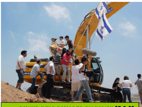
27.5.05 עוצרים את הדחפורים בפעם השנייה