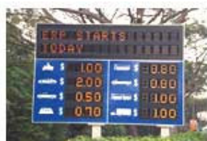
כך זה עובד בסינגפור

בניגוד ללונדון, אזור הגבייה הוא קטן יותר, והתשלום אינו יומי אלא מתבצע, בכל פעם שכלי-רכב עובר בנקודת תשלום. יש לציין, שנקודות התשלום, הממוקמות אסטרטגית ברחבי העיר, הן אלקטרוניות, והתמסורת בינן לבין כלי-הרכב נעשית בצורה ממוחשבת. הנהגים משלמים על ידי טעינת כרטיס בכסף (כמו talkman). ומה קורה, כשאינו כסף בכרטיס? הנהג מורשה לעבור אבל נאלץ לשלם קנס. כך גם במקרה שאין ברשותו יחידת התשלום הממוחשבת.