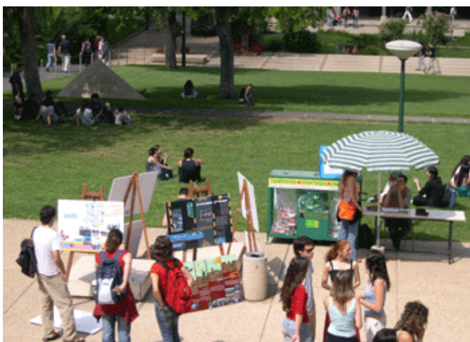
יום ירוק בפקולטה לחקלאות