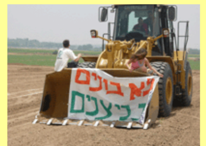
בשער: פעילי מגמה ירוקה עוצרים את הבנייה