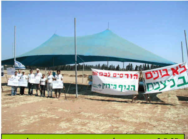
8.5.05 הקמת אוהל המחאה בשטח המיועד לבנייה

מגמה ירוקה איננה נוקטת עמדה באשר לשאלת ביצוע תוכנית ההתנתקות. אישים רבים משני קצוות הקשת הפוליטית (עוזי לנדאו, אופיר פינס, עומרי שרון ועוד) מתנגדים להעתקת היישובים לחולות ניצנים.