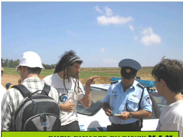
25.5.05 עוצרים את הדחפורים בידיים

עצמאיים) ושביום חוסמים בגופם את ההרס. "זה הזמן" הם קוראים בקול, "כאן ועכשיו אנו נלחמים את מלחמת הקודש למען ילדינו, למען ארץ ישראל, למען הסביבה, למען החולות!". בלי ספק יש כאן במרחקים איזה ים, מים שאין להם סוף - עשרות סטודנטים המטיים שכם אל שכם, שיוכלו להציל את השמורה. כי אין תחליף לניצנים !